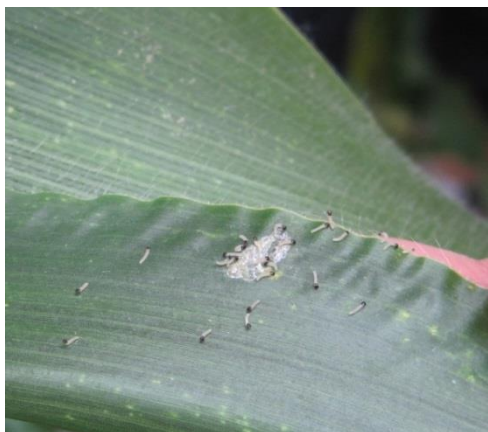
Éclosion des larves de pyrales : stade « baladeur »