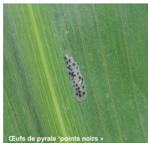
Œufs de pyrale 'points noirs' »

Les œufs frais sont blancs, puis deviennent beiges et laissent finalement apparaître des points noirs, correspondant aux têtes des futures larves.