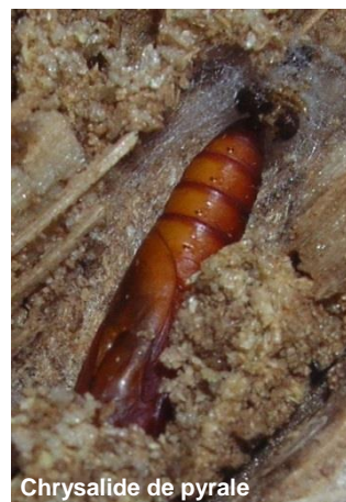
Chrysalide de pyrale

La durée du développement nymphal, fonction de la température, est de trois semaines en moyenne.