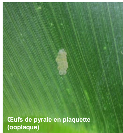
Œufs de pyrale en plaquette (ooplaque)

Les œufs sont groupés en ooplaques de 5 à 10 mm, regroupant une vingtaine d'œufs.