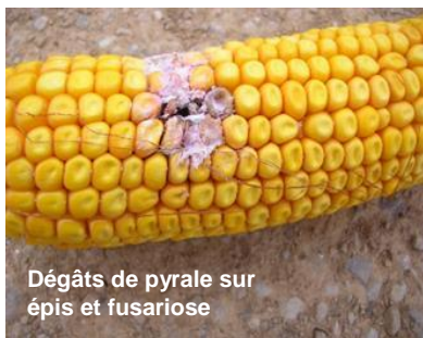
Dégâts de pyrale sur épis et fusariose