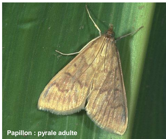
Papillon : pyrale adulte

L'adulte est un papillon gris de 20 à 33 mm d'envergure. Il peut se déplacer dans un rayon de 2 à 3 kilomètres.