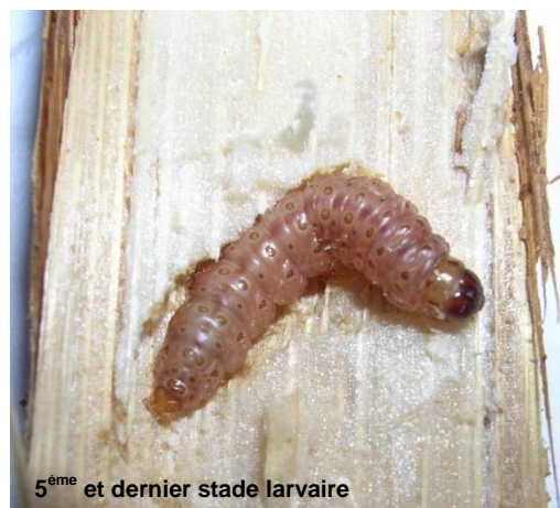
5 ème et dernier stade larvaire

A l'automne, les chenilles de dernier stade larvaire migrent vers la base des pieds de maïs ou dans les épis pour y hiverner. Elles entrent alors en diapause, et sont capables de résister à des températures très basses (-32°C pendant 20 jours).