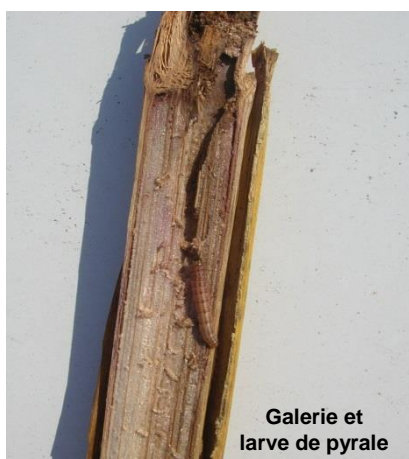
Galerie et larve de pyrale

A leur cinquième et dernier stade larvaire, elles atteignent 20 mm environ. Elles sont alors gris-jaunâtres voire rosées.