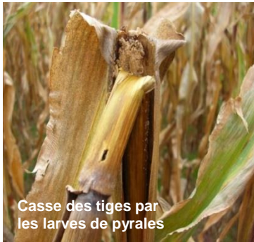
Casse des tiges par les larves de pyrales