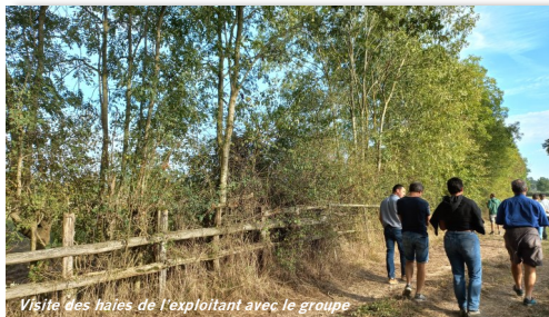
Visite des haies de l'exploitant avec le groupe

Si vous êtes éleveur dans le département et que vous voulez rejoindre ce GIEE, contactez le Syndicat caprin : syndicatcaprin@sl.chambagri.fr