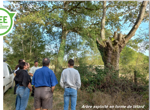
Arbre exploité en forme de têtard

Le groupe a pu découvrir comment entretenir sa haie pour pouvoir l'exploiter afin de pouvoir mieux la valoriser sur son exploitation (comme litière par exemple) et comment valoriser de la chaleur au travers des plaquettes bois.