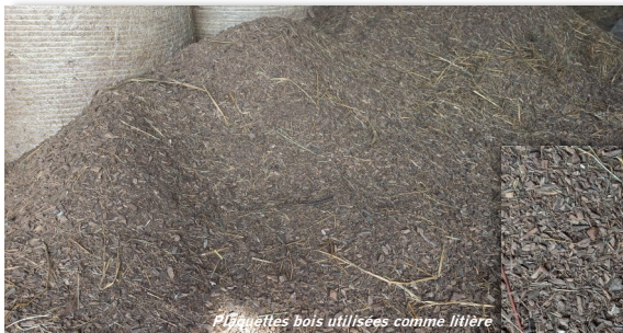
Plaquettes bois utilisées comme litière