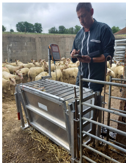
50 éleveurs suivis en contrôle de croissance ovin.

L'étude de consommation d'eau dans les chais, débutée en 2021, s'est poursuivie avec 3 viticulteurs suivis sur la période de vendange-vinification. Un plan d'action sur des préconisations propres à chaque domaine pour réduire leurs besoins en eau a été mis en place.