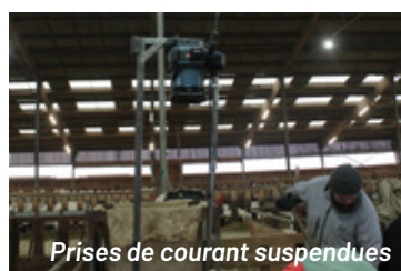
Prises de courant suspendues