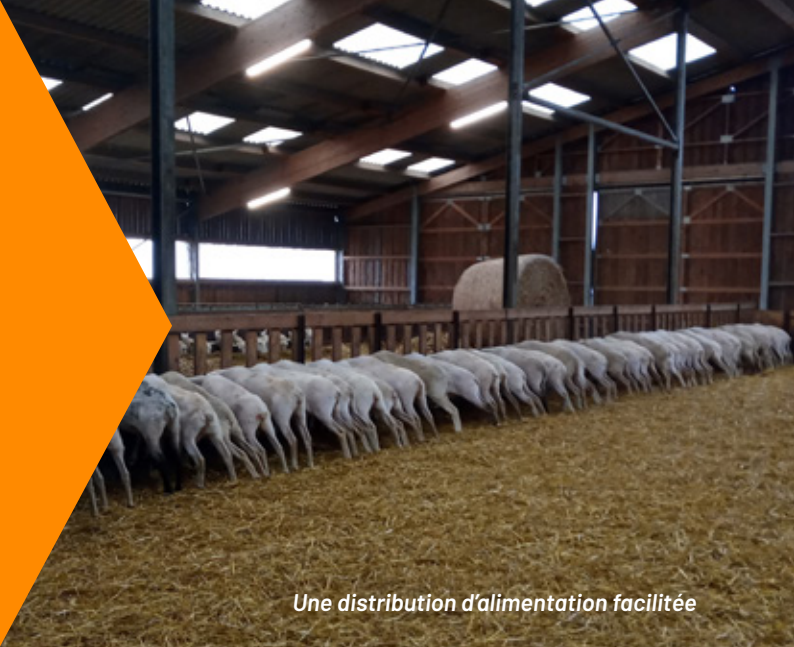
Une distribution d'alimentation facilitée