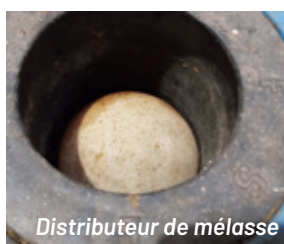
Distributeur de mélasse