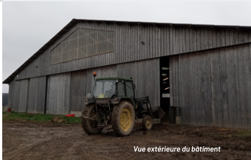
Vue extérieure du bâtiment

Cage de tri, de retournement, de contention, case avec porte de tonte, cage à IA