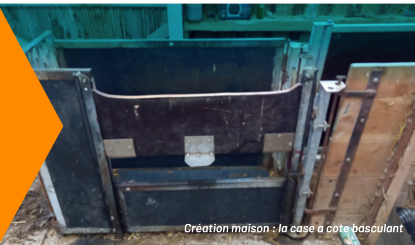
Création maison : la case a cote basculant

87.20 €/m 2 pour 1750 m 2 Soit 280 €/brebis logée