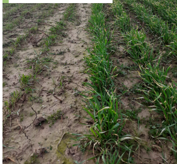
À gauche, la zone pâturée par les brebis

Ne pas dépasser le stade tallage pour des rendements en grains maintenus