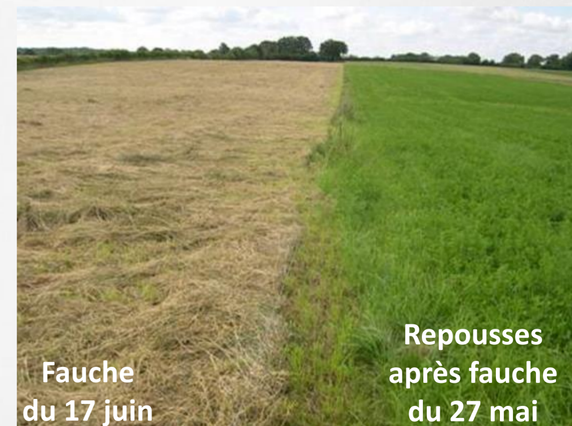
Prairies multi-espèces au 21/06