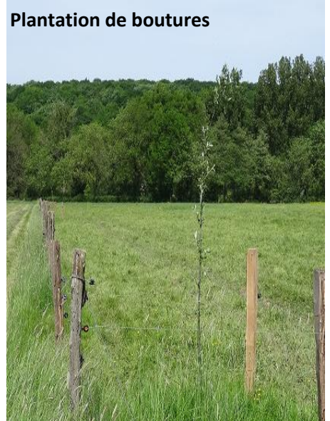
Plantation de boutures