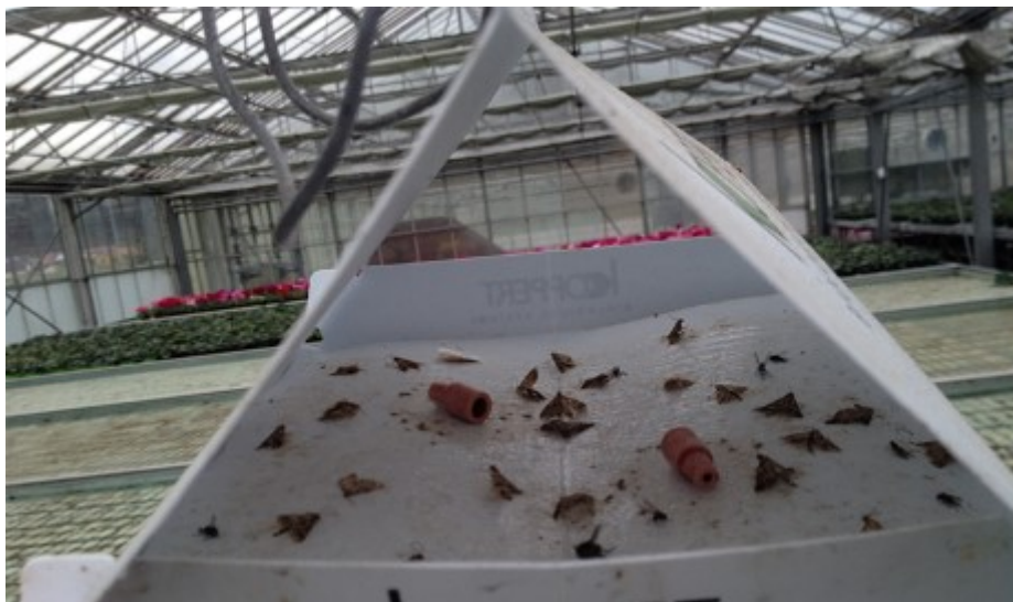
Piège à phéromones pour duponchelia

Elle est présente dans les cultures d'annuelles qui trainent un peu, il faut mettre les pièges, les séries de cyclamens vont arrivées !