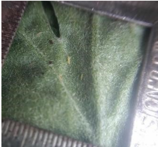
De nombreuses larves de thrips sur feuille de chrysanthème

Toujours la même vigilance : à la réception des boutures qui arrivent avec des thrips pour certains fournisseurs !