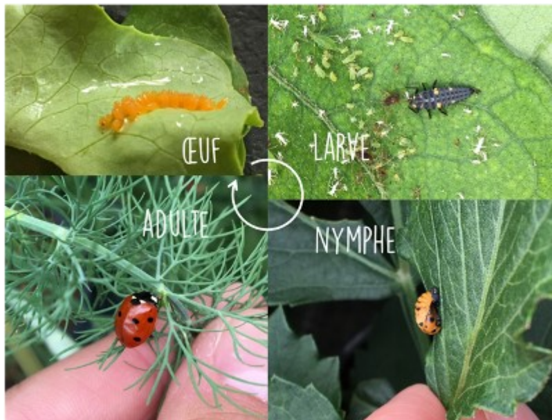
Les différents stades de la coccinelle à 7 points