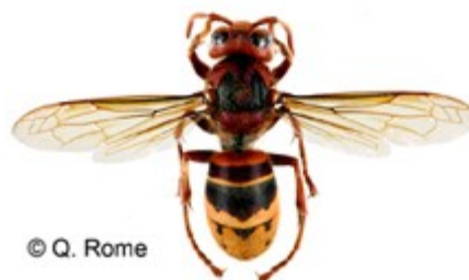
Frelon Asiatique Vespa velutina