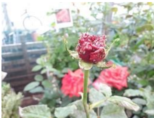
Oidium sur hortensia (photo EH Bourgogne) - Pucerons sur rosier (photo EH Bourgogne)