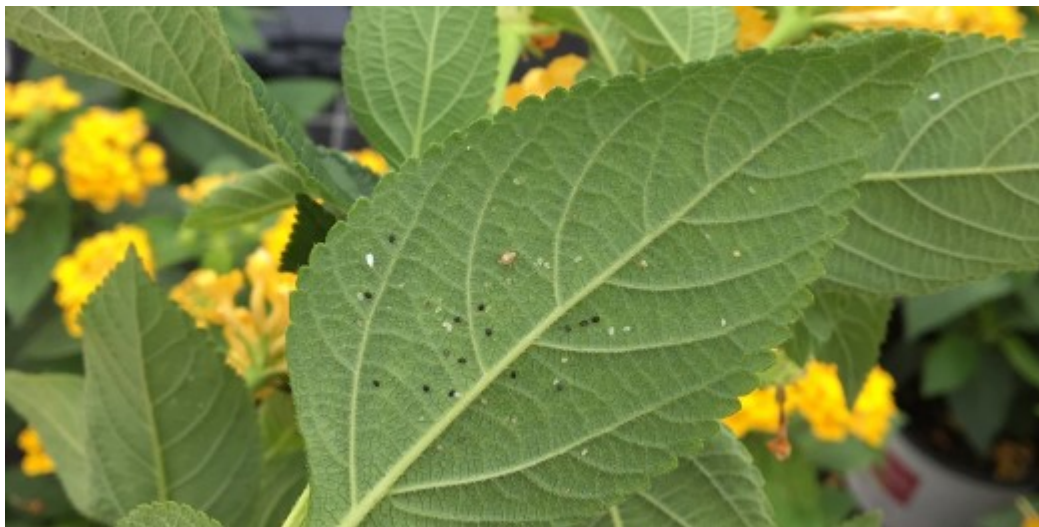
Stades jeunes aleurodes sur lantana, certains sont noirs = parasités