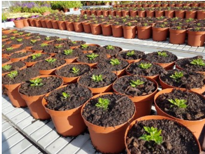
Mise en place des cultures de chrysanthèmes

Il faut placer des seaux d'athéta dans les cultures.