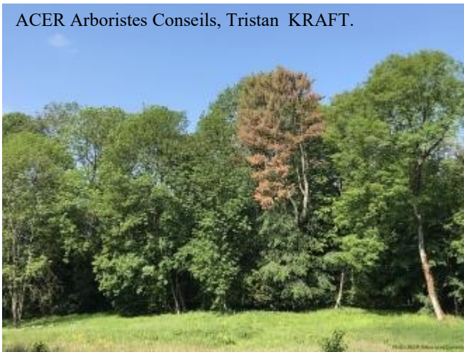
Pinus nigra Austriaca , Besançon (25), 22 mai 2019.