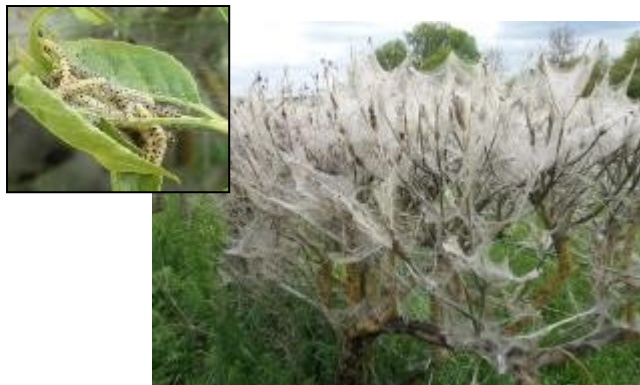
Chenilles d'hyponomeutes et toiles tissées par les chenilles et arbuste entièrement défolié, le 17/05/2019.