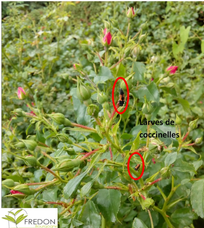
Pucerons sur boutons floraux de rosiers à Beaune, le 12/06/2019.