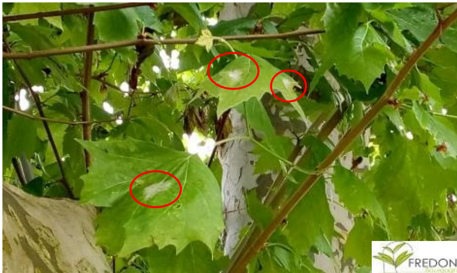
Oïdium sur platane, le 12/06/2019, à Beaune (21).