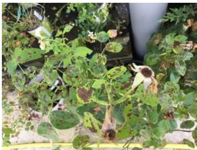
Oidium sur rosier - Taches noires sur rosier : Marssonina rosae