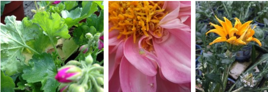
Pucerons sur géranium zonal et sur dahlias – pucerons sur gazania

Ces observations sont réalisées sur des cultures en fin de cycle !