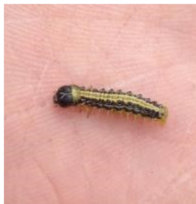
Stade chenille de pyrale du buis : taille 1 cm - chenille à un jeune stade