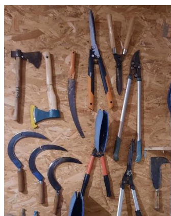
▲ Outils de récolte