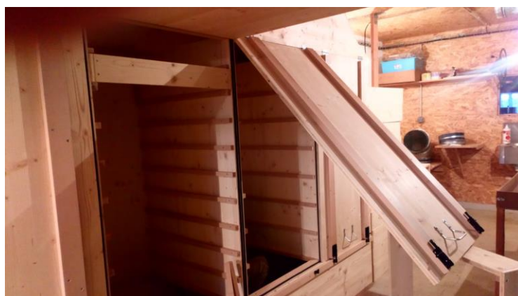
◀ Armoire de séchage 6m 3