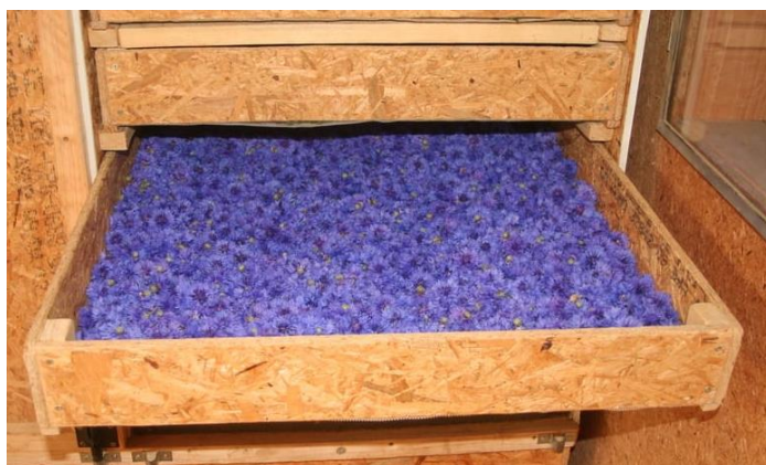
▶ Claie remplie pour séchage