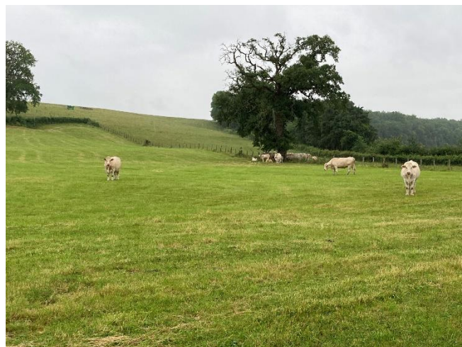
La fauche précoce permet de diminuer le chargement au pâturage dès la mi-juin

La pluie a permis aux prairies déjà récoltées de redémarrer. Celles-ci peuvent maintenant être intégrées dans le circuit de pâturage afin d'adapter le chargement à la pousse de l'herbe, moins soutenue à cette saison qu'en début de printemps.